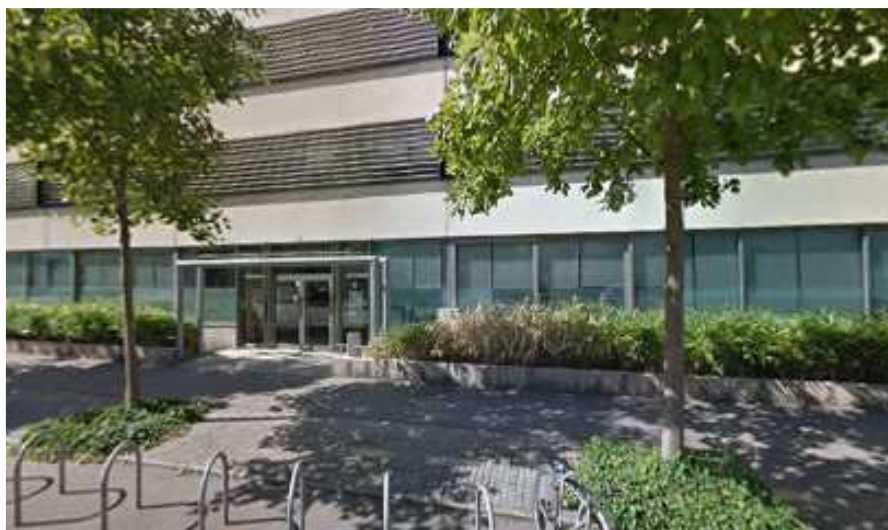
Vue de l'entrée de l'immeuble Onyx